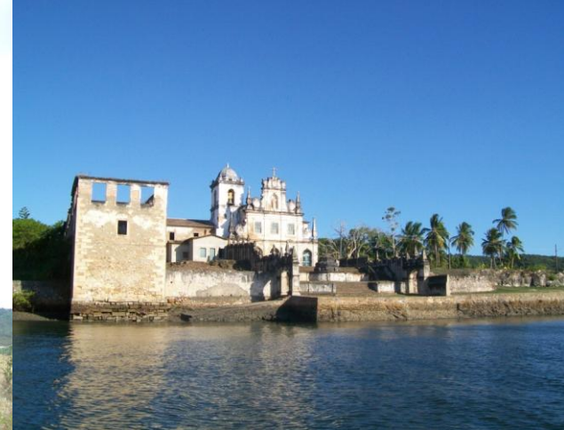
Igrejas (capelas e conventos)