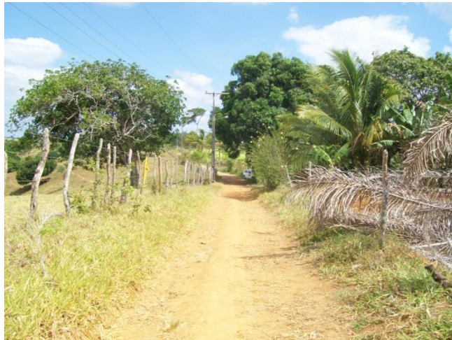
Comunidade Miudinha; Zona Rural de São Félix - Sítio Tupi