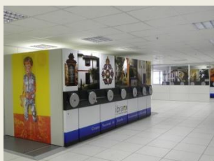
Biblioteca Depositária (BD)

O Boletim Bibliográfico do Cenedom é destinado à difusão regular das publicações sobre museologia e o campo museal, que compõem a biblioteca do Cenedom.