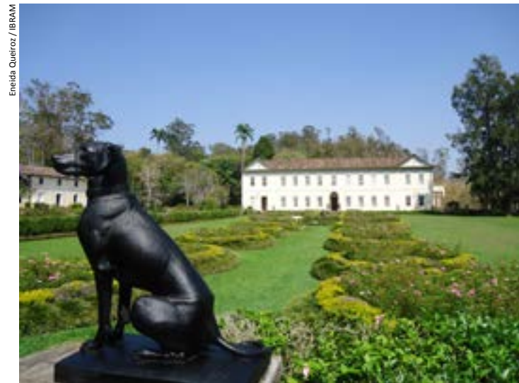
Eneida Queiroz / IBRAM

A Fazenda do Secretário tem origem no ano de 1703, quando José Ferreira da Fonte, secretário do governador da província do Rio de Janeiro, adquiriu as terras. Nessa época ainda não se plantava café na região. Em 1830, a fazenda foi comprada pelo avô materno de Eufrásia, o nosso já conhecido Laureano Corrêa e Castro, o Barão de Campo Belo. Nas mãos desse cafeicultor a fazenda possuiu mais de 500 mil pés de café e mais de 300 escravos. Hoje, é um dos melhores exemplos de solar em estilo neoclássico, herdeiro do café no Brasil. Além do belo solar, dos jardins magníficos, a fazenda ainda possui o Córrego do