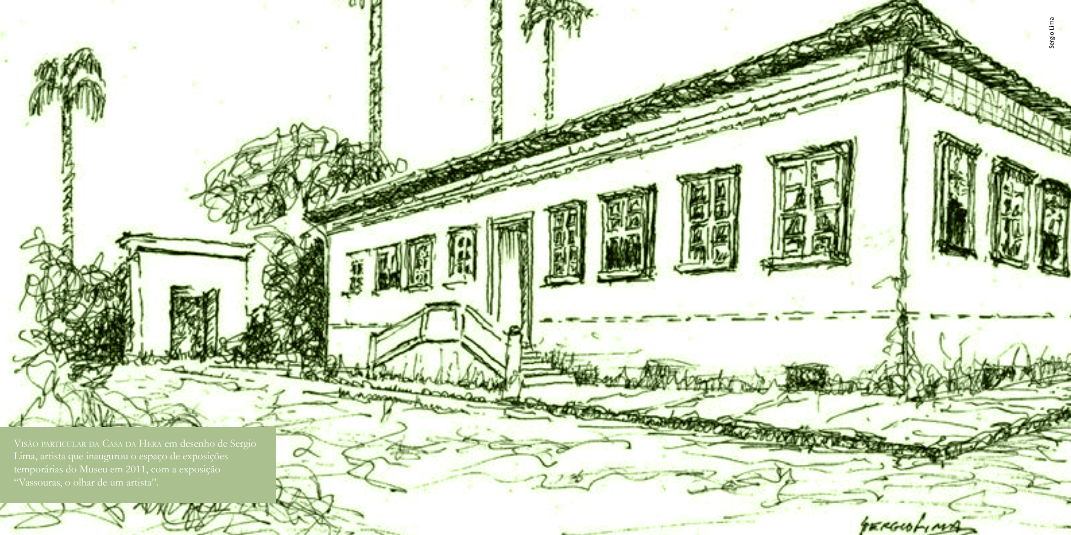
VISÃO PARTICULAR DA CASA DA HERA em desenho de Sergio Lima, artista que inaugurou o espaço de exposições temporárias do Museu em 2011, com a exposição “Vassouras, o olhar de um artista”.