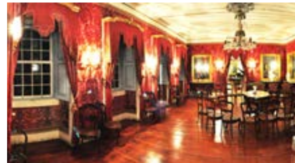
VISÃO PARCIAL DO SALÃO VERMELHO.

A sala de jantar é um ambiente híbrido, acumulando funções sociais e íntimas. A riqueza do ambiente, com papel de parede floral e luxuoso jogo de jantar disposto sobre uma mesa de 16 lugares, nos dá