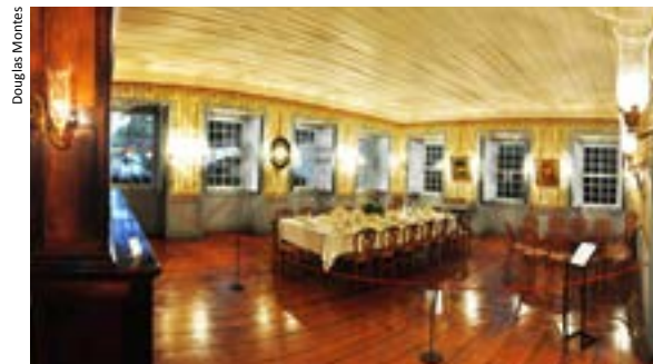
VISÃO PANORÂMICA DA SALA DE JANTAR. A cristaleira (à esquerda da foto) abriga a louça da família. Sobre a mesa, encontra-se um jogo de jantar de porcelana com filetes em ouro. Ao lado da mesa, temos o Conjunto Thonet, mobiliário de estilo austríaco.