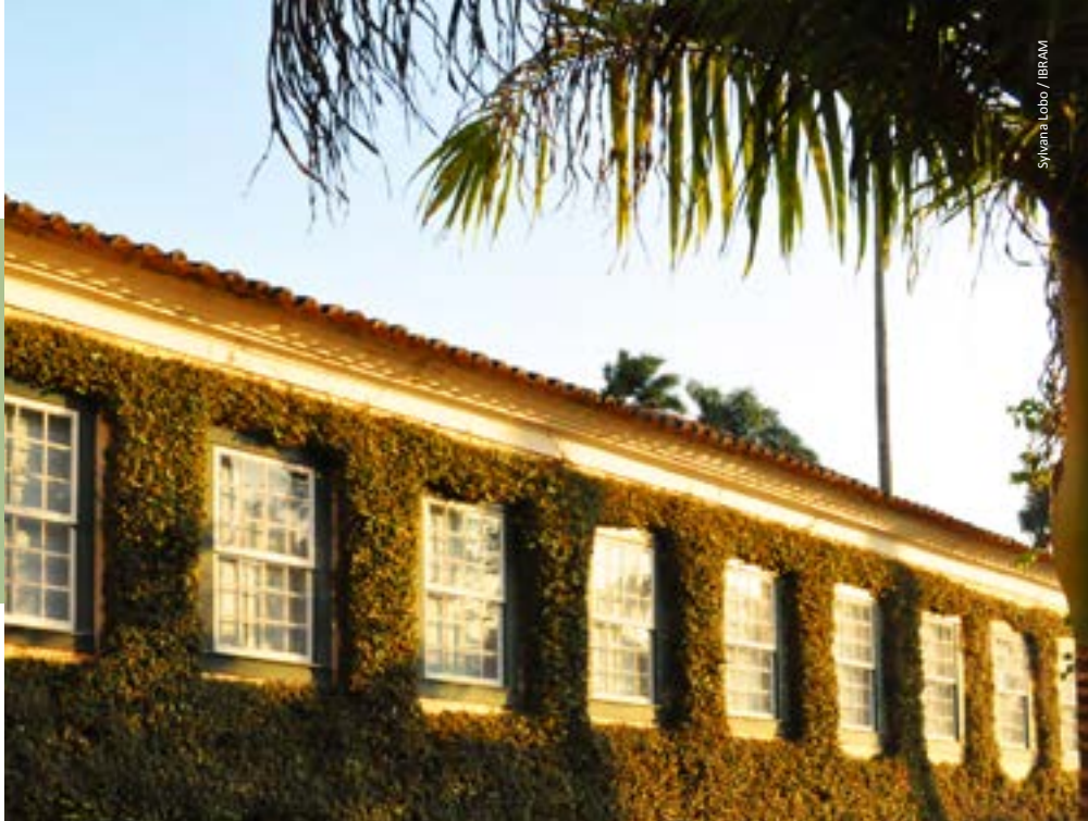
Sylvana Lobo / IBERAM