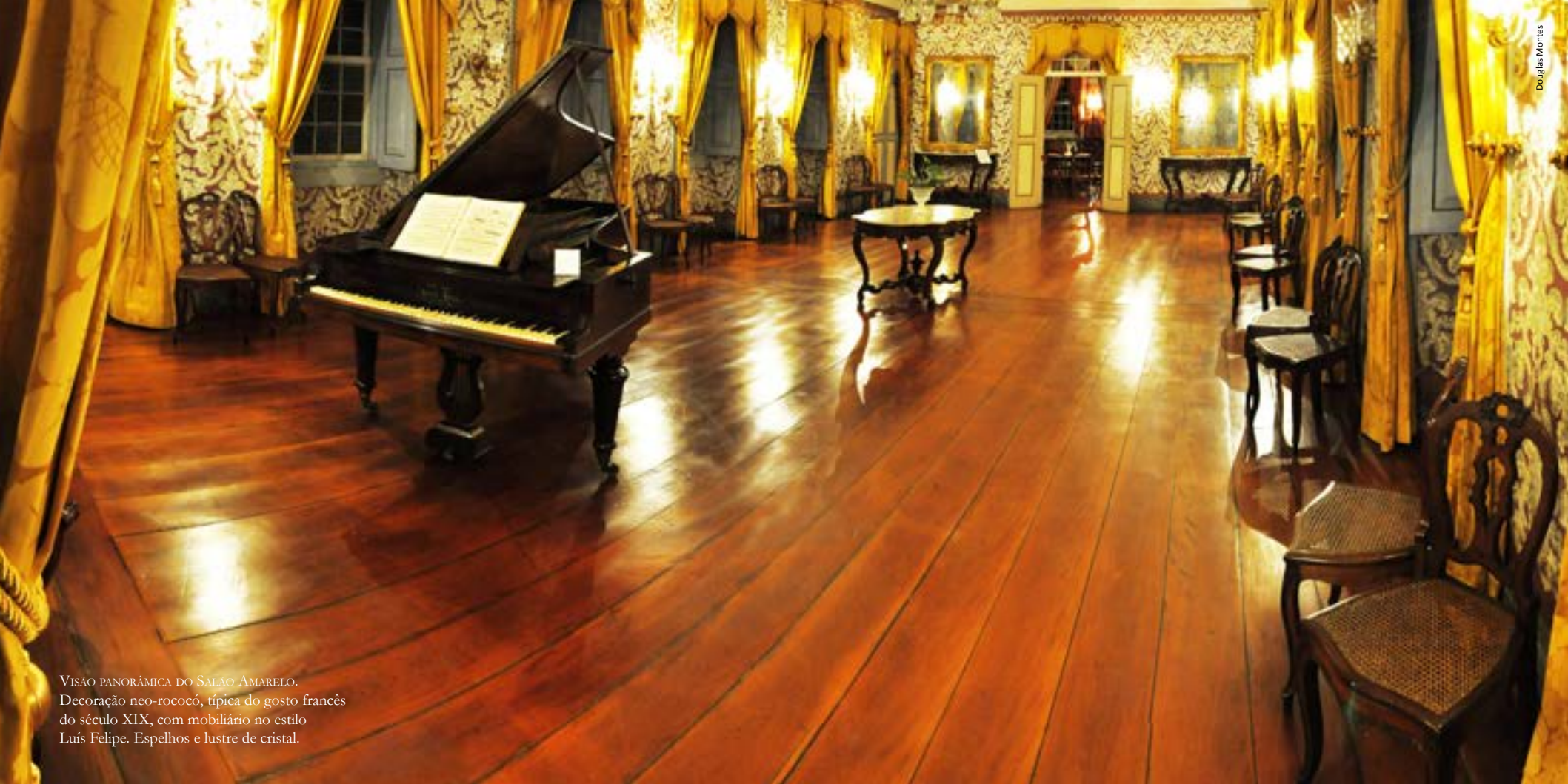
VISÃO PANORÂMICA DO SALÃO AMARELO. Decoração neo-rococó, típica do gosto francês do século XIX, com mobiliário no estilo Luís Felipe. Espelhos e lustre de cristal.