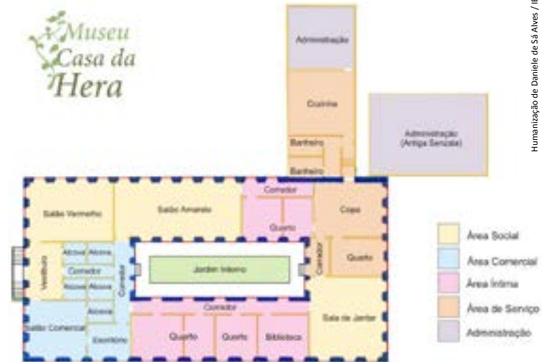
PLANTA BAIXA DO MUSEU. Casa térrea, que se apresenta na forma de retângulo vazado, formando pátio interno.