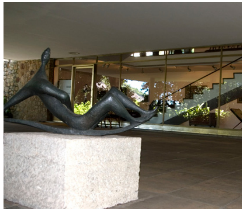
Museu Chácara do Céu.

EXPOSIÇÃO - "Direito Ambiental nas fontes do Poder Judiciário" - Busca mostrar as origens históricas da formação do pensamento do Direito Ambiental Local: Salões Nobre e dos Espelhos. 19/06/2012 a 31/12/2012 - 11h às 17h