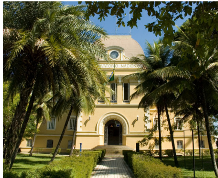
Museu de Astronomia e Ciências Afins

VISITA GUIADA - Visita guiada pelo sítio histórico, local de fundação da cidade do Rio de Janeiro e visita ao Museu do Desporto do Exército. 13/07/2012 a 22/07/2012 - 10h às 15h