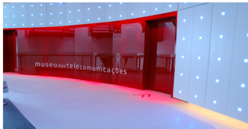
Museu das Telecomunicações - Di Futuro

AÇÃO EDUCATIVA - Visita teatralizada da Palhaça do Museu das Telecomunicações Di Futuro com mediação do Programa Educativo. Público: crianças de 3 a 7 anos. 30/06/2012 - 15h às 17h